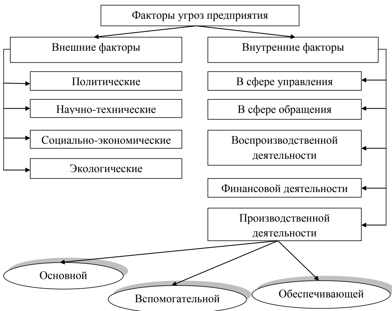
Рис.1 Классификация угроз безопасности предприятия

Для оценки уровня экономической безопасности целесообразно выделить четыре группы внешних факторов угроз устойчивому функционированию предприятия: политические, социально-экономические, экологические и научно-технические.