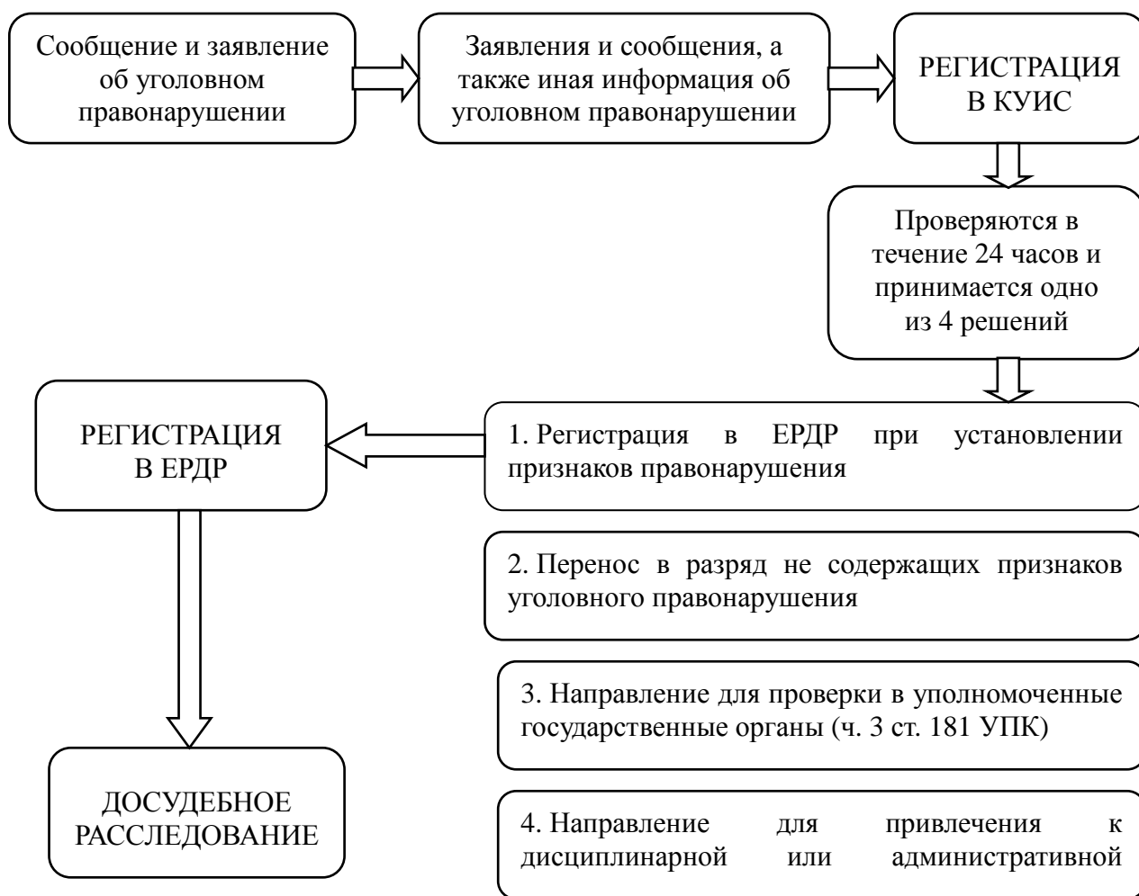
Таблица № 1.

Целями создания ЕДР являются обеспечение единого учета уголовных правонарушений и лиц, их совершивших, а также принятых в ходе досудебного расследования решений по ним. Суточный срок ввода информации в ЕДР позволит оперативно контролировать весь процесс досудебного расследования с момента регистрации обращения до его направления в суд.