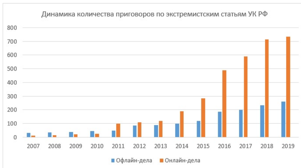
Рис. 2. Динамика количества приговоров по экстремистским статьям УК РФ

Согласно данным МВД России, в последнее десятилетие преступления экстремистской направленности в подавляющем большинстве перешли в категорию деяний, совершаемых в информационном пространстве. Так, в ходе анализа официальной статистики количества приговоров по «экстремистским» статьям УК РФ была сформирована диаграмма, иллюстрирующая данный показатель в ретроспективной динамике с 2007 по 2019 г. (рис. 2) 1 .