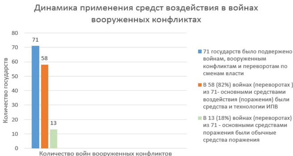
Рис. 1. Динамика применяемых средств в войнах, вооруженных конфликтах и переворотах по смене власти в период с 1991 по 2020 г.

Согласно данным МВД России, в последнее десятилетие преступления экстремистской направленности в подавляющем большинстве перешли в категорию деяний, совершаемых в информационном пространстве. Так, в ходе анализа официальной статистики количества приговоров по «экстремистским» статьям УК РФ была сформирована диаграмма, иллюстрирующая данный показатель в ретроспективной динамике с 2007 по 2019 г. (рис. 2) 1 .