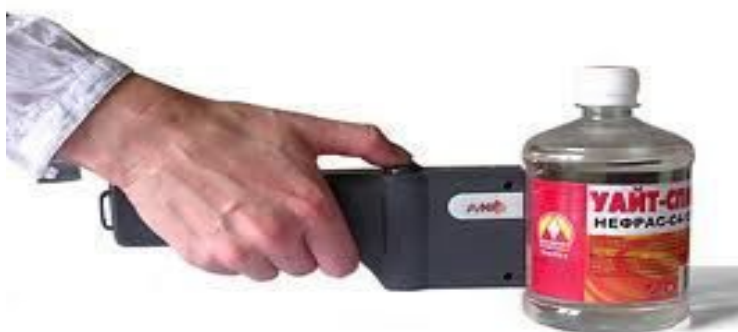
Рис. 13. Обнаружитель опасных жидкостей LQ-test

Сканер Ватсон представляет собой портативный (ручной) рентгеновский аппарат для досмотра оптически непрозрачных полостей, в котором реализован метод регистрации обратно рассеянного рентгеновского излучения. При включённом сканере рентгеновское излучение создаваемое генератором в виде плоского веера, расходящегося под углом 40^\circ или 60^\circ , направляется на сканируемую оптически непрозрачную поверхность. Встречаясь с поверхностью и находящимися за ней предметами, рентгеновские лучи поглощаются и отражаются (рассеиваются) ими. Рассеянные лучи принимаются (регистрируются) приёмником (детектором) прибора. Текущие уровни принятого рассеянного излучения отображаются в виде чисел на дисплее сканирующего устройства.