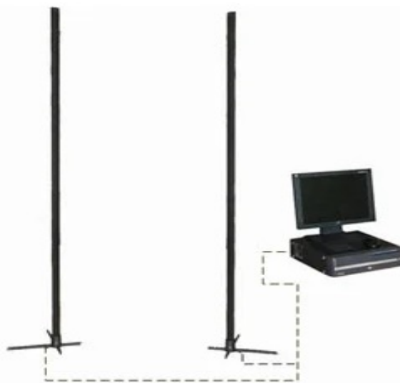
Рис. 3. Томограф «Зонд-П»