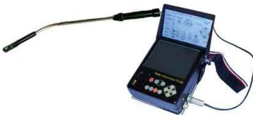
Рис. 6. Телевизионная система досмотра автомобиля «Эстакада-8»

Комплект тактических видеоэндоскопов и специальных досмотровых технических средств «Констебль» удобен в использовании поскольку имеет в своем составе как досмотровые зеркала, так и эндоскопы с различными видеокамерами, подсветкой и телескопическими штангами длиной до 3 и 5 метров. Изображение с видеокамер передается на экран. Техническое исполнение данного прибора позволяет использовать его как для досмотра труднодоступных мест (к примеру, на транспортных средствах или каких-либо грузах), так и безопасного осмотра плохо освещенных помещений (см.: рис. 7).