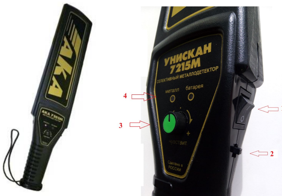
Рис. 1. Ручной селективный металлодетектор АКА «Унискан 7215М»

На вооружении органов внутренних дел могут находиться различные образцы ручных металлоискателей. Как правило, в своей структуре они имеют клавишу включения, ролик настройки чувствительности металлодетектора, световую и звуковую индикацию обнаружения металла (см.: рис. 1).