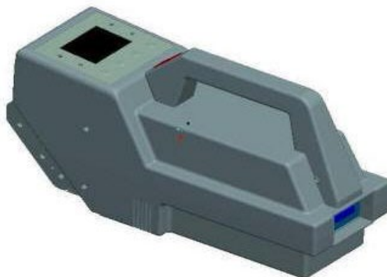
Рис. 12. Дрейф-спектрометр «САПСАН-1»