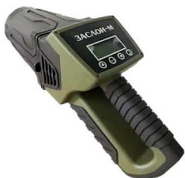
Рис. 11. Мобильный обнаружитель взрывчатых веществ «Заслон-М»