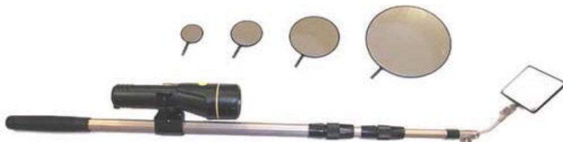
Рис. 5. Комплект досмотровых зеркал «Поиск-2»

На пунктах досмотра, где предполагается обследование транспортных средств, должны иметься комплекты досмотровых зеркал и/или эндоскопов (см.: рис. 5, 6) 1 . Указанные приспособления позволяют выполнить визуальный досмотр труднодоступных и неосвещенных мест в транспортных средствах и грузах (под днищем, крыльями, бамперами автомобиля, моторном отсеке и т. д.).