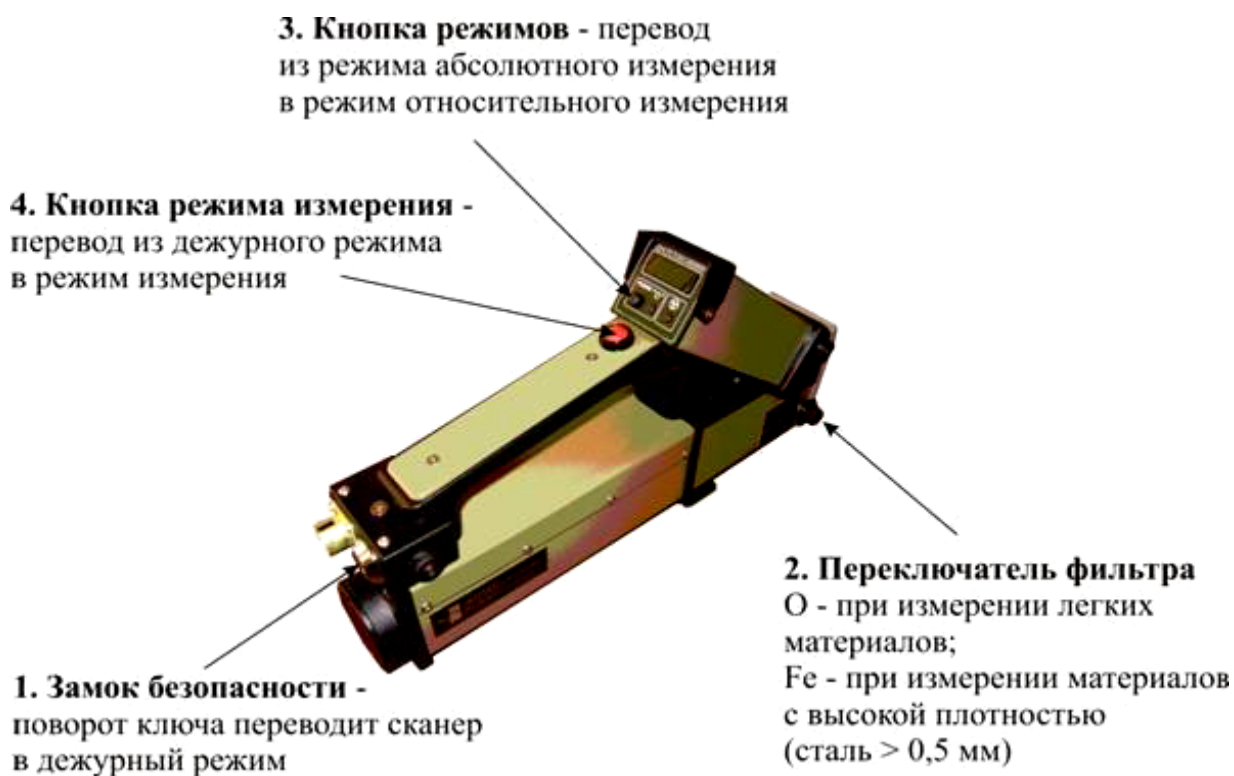
Рис. 10. Рентгеновский сканер скрытых полостей «ВАТСОН»

На досмотровом пункте также могут применяться: досмотровая рентгеновская техника, ручной сканер скрытых полостей (см.: рис. 10), средство обнаружения взрывчатых веществ (см.: рис. 11, 12), индикатор опасных жидкостей (см.: рис. 13).