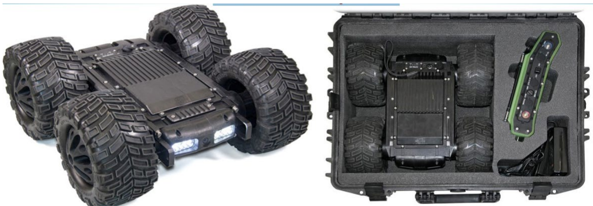
Рис. 8. Управляемый досмотровый робототехнический комплекс «Скарабей»

Отличительными особенностями комплекта «Скарабей» являются его высокая проходимость, мощные светодиодная (белая) и инфракрасная подсветки, амортизация удара при падении (с высоты до 1 м), скорость перемещения до 5 км/ч.