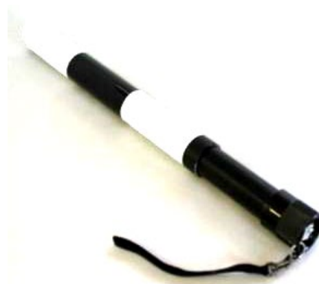
Рис. 2. Ручной металлоискатель «Жезл»

Выгодно отличается от иных моделей арочных металлодетекторов обнаружитель ферромагнитных объектов марки «ЗОНД-П» российского производителя (рис. 3). Его преимущества состоят в том, что он является пассивным, т. е. в контролируемой им зоне пространства он не создает активного зондирующего излучения во всем диапазоне частот. Благодаря этому он не оказывает негативное влияния на здоровье сотрудника полиции, несущего службу возле него. Кроме того, этим обеспечивается безопасность поиска взрывных устройств, ввиду отсутствия риска их случайной детонации. Исполнение прибора обеспечивает его мобильность и возможность скрытной установки.