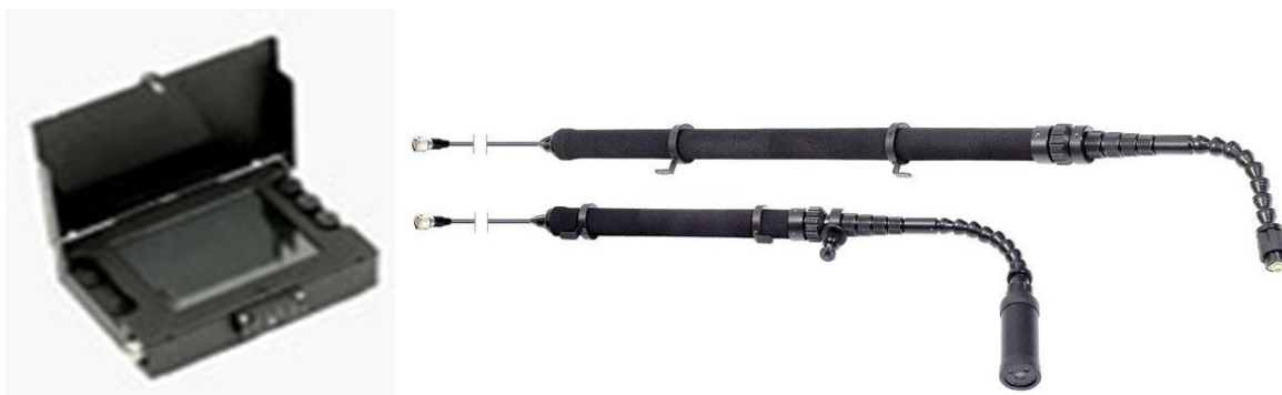
Рис. 7. Комплект тактических видеоэндоскопов и специальных досмотровых технических средств «Констебль»

Представляет интерес применение роботизированных беспроводных досмотровых комплексов, таких как, например, управляемый досмотровый робототехнический комплекс «Скарабей» (см.: рис. 8) и беспроводное досмотровое устройство «Сфера» (см.: рис. 9).