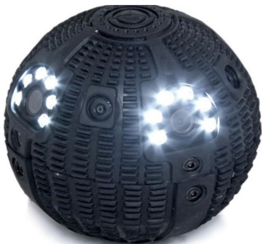
Рис. 9. Досмотровое устройство «Сфера»

Досмотровое устройство «Сфера» также предназначено для оперативного сбора информации в труднодоступных и опасных для человека зонах, и представляет собой шар с четырьмя ТВ-камерами со светодиодной подсветкой, с микрофоном и передатчиком информации. Шар предназначен для забрасывания в труднодоступные зоны. Снабжён устройством позиционирования – автоматически принимает вертикальное положение. Обладает уникальной возможностью передачи видеoinформации одновременно от четырёх ТВ-камер без потери качества изображения.