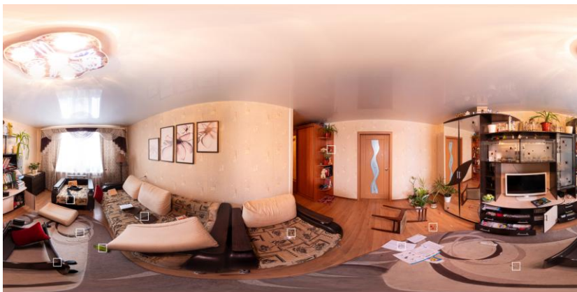
Пример 3D-модели места происшествия (диалоговое окно АПК)