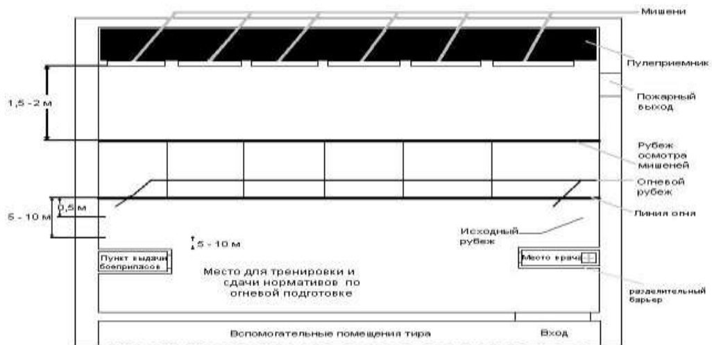
Рисунок 1. Типовая схема устройства и оборудования тира в подразделении ОВД