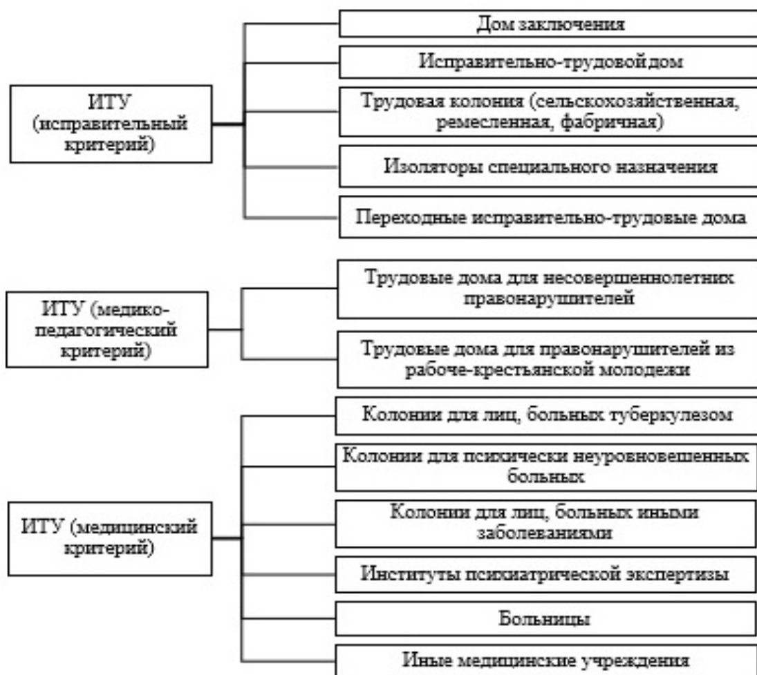
Рисунок 1. Классификация исправительно-трудовых учреждений согласно ИТК РСФСР 1924 года по различным типам (критериям)

просами занимались распределительные комиссии при губернских (областных) инспекциях мест заключения. Первый вид дифференциации представлял собой распределение по ИТУ различных типов [10] (рисунок 1)